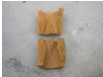
Tuyère trifide (lot de 3 tuyères)