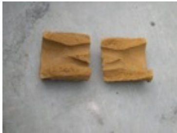
Tuyère bifide coupée en deux (cassée)